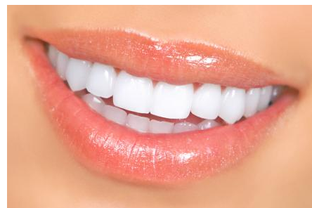
Power-Bleaching: Sichtbar hellere Zähne nach einer Stunde

Was kann man tun, wenn nur ein einzelner Zahn dunkel ist? Auf der nächsten Seite finden Sie Informationen zur Einzelzahn-Aufhellung!